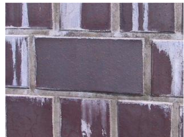
Extreme Auslaugungen vor und nach der Behandlung mit TIMOX

Selbst Mörtelreste können die Optik beeinträchtigen. Auch kleine Unfälle wie z.B. Ölverschmutzungen durch einen geplatzten Hydraulikschlauch oder Abplatzungen durch Baugeräte fordern ihre Lösungen.