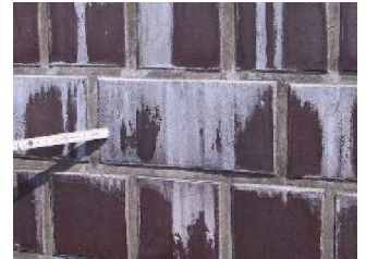
Extreme Auslaugungen vor und nach der Behandlung mit TIMOX

Sogar für die Beseitigung von den so genannten „Newton'schen Ringen“ haben wir eine einfache und dauerhafte Lösung gefunden.